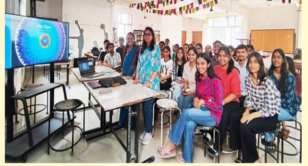
Department of Sociology

વંશના શાસન દરમિયા થયું હતું. મંદિરની દિવાલ પર રામાયણ અને મહાભારતની મુખ્ય પ્રાસંગિક ઘટનાઓ, તેમજ ગજલક્ષ્મી, રાવણ શેકીંગ કેલાશ, સપ્તમાત્રિકા, નૃત્ય કરતા શિવ, નરસિંહા કરતા શિવ, નરસિંહા, કલ્યાણ સુંદરમ અને અન્ય દેવતાઓની અદભૂત કોતરણી છે. આ મંદિર કઈ રીતે હજુ પણ સ્થિર છે એ અંગે કહેતા જણાવ્યું કે એક ચૌકકસ પ્રકારની યંત્રોની ગણતરી અને ભૌમિતિક રચનાઓને ધ્યાનમાં આરખવામાં આવ્યો છે જેમાં રી યંત્ર પણ છે.