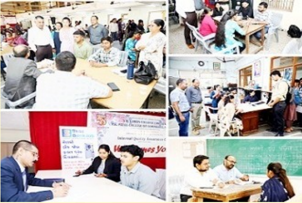
અગ્રવાલ વિદ્યાવિહાર ઇંગ્લિશ મીડીયમ કૉલેજ, સુરત.