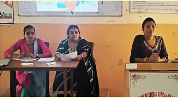
Department of English organized online inter college quiz on World Mother Language Day