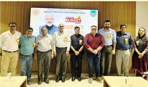
યુનિયન બજેટ ૨૦૨૬: Budget Talk @ Campus